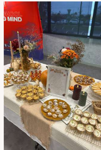
Fin de formation comptable Rydge & EM Normandie