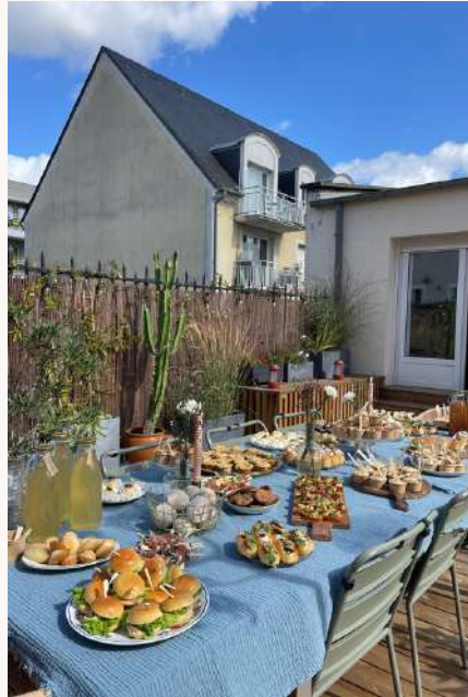
Inauguration du label Duchess à Caen