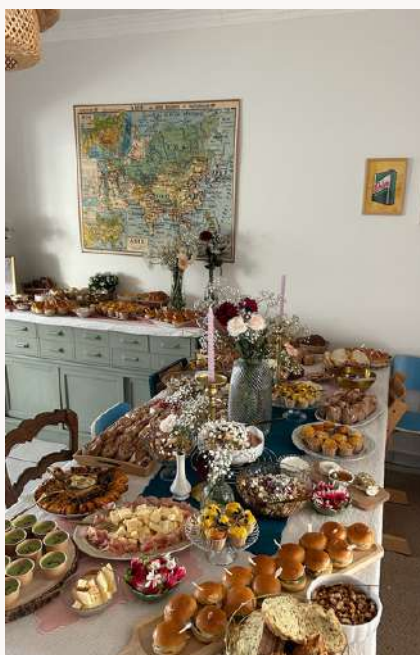
Buffet dressé au domicile de nos clients.